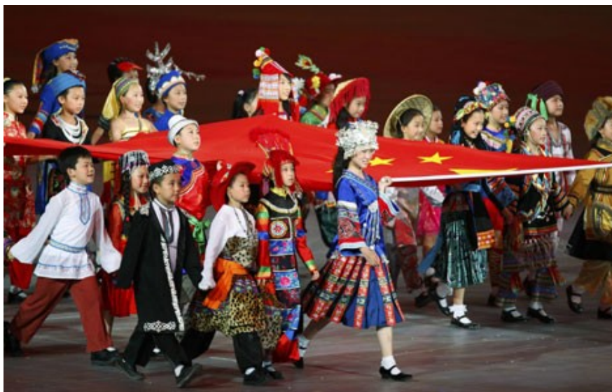
Imagen No 1

Una segunda clave para la comprensión de la visión de China sobre América Latina es su énfasis en la coherencia regional y la diversidad dentro de la unidad. Esto se ilustra mejor con una escena de la ceremonia inaugural de los Juegos Olímpicos de 2008, cuando los niños que representan a las 56 nacionalidades de la RPC marcharon bajo la bandera nacional (ver imagen No 1). El gobierno chino está muy interesado en la unidad nacional en su propio contexto cultural y nacional, y en la integración regional y la cooperación a nivel internacional. Un sinnúmero de declaraciones y artículos reflejan la opinión oficial de subrayar esta perspectiva: en las palabras de Wen Jiabao, “Creemos firmemente que el crecimiento de América Latina y el Caribe corresponde a los intereses de la paz mundial y el desarrollo.” De manera similar, Sun Hongbo explica que “China confía en el desarrollo estable y sano de la Comunidad de Estados Latinoamericanos y del Caribe, y espera que esto pueda convertirse en una importante plataforma para el diálogo entre China y América Latina y la cooperación regional en el futuro” 19 .